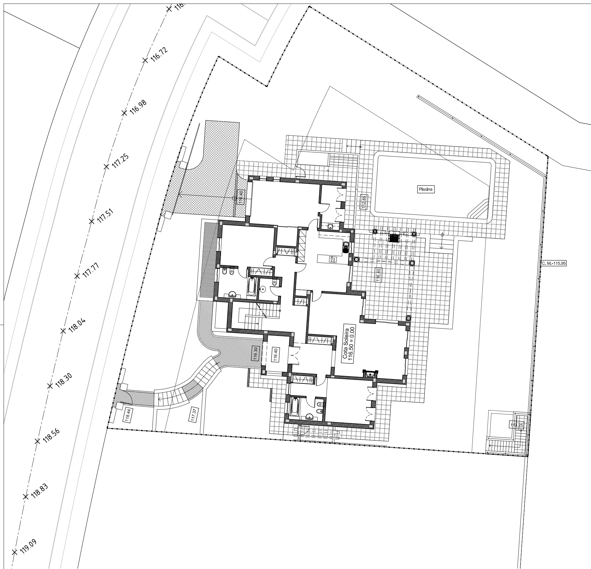
Planta de Implantação escala 1/200